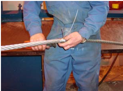
Montering av bendselwire

Deretter sikrer en enden på kabelstrømper med en bendselwire eller en ståltråd ved å surre bendselwiren rundt enden av kabelstrømper. Deretter ruller en tape over bendslingen slik at der ikke er noen skarpe kanter som kan henge seg fast under treding av wiren.