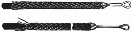
Trekk og skjøtestrømpe for ståltau og kabler