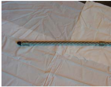
Bendselwire påmontert på i enden og inne på wire